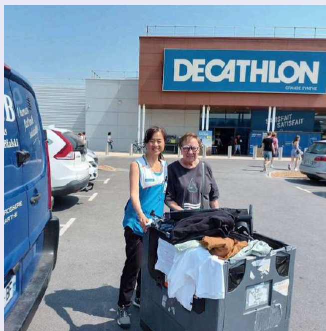
DON DE DECATHLON AUX AMIS DE JACQUES BIALSKI EN 2023