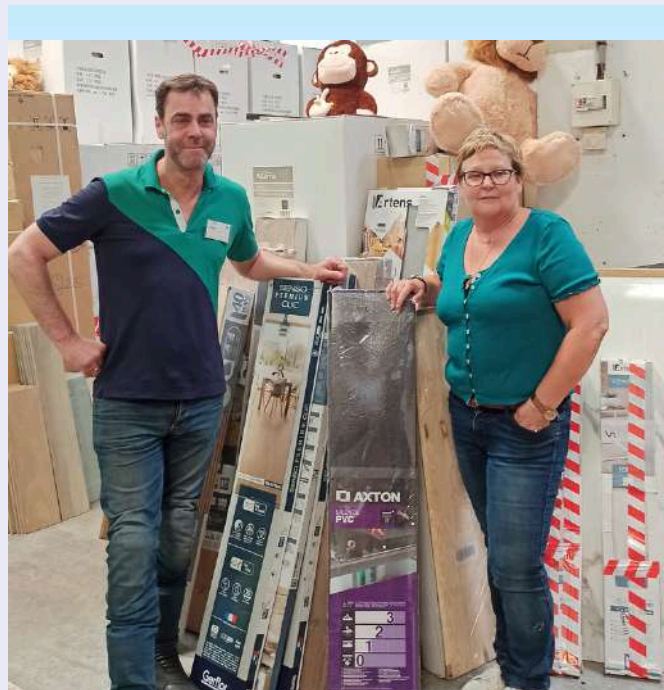
DON DE LEROY MERLIN À SPF DE CERGY EN 2023